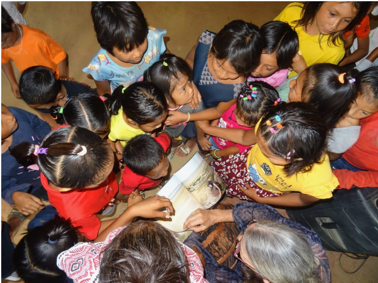
Afbeelding 1: Inheemse kinderen in Suriname verdringen zich om een kinderbijbel in eigen taal